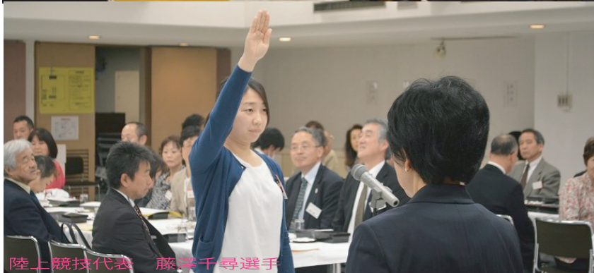
陸上競技代表 藤澤千尋選手