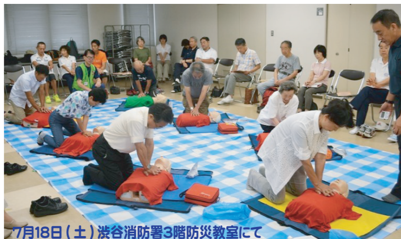
7月18日(土) 渋谷消防署3階防災教室にて

突然の事故や急病人が発生した場合、救急車 到着までの応急手当が重要です。 胸骨圧迫と人工呼吸を併用した心肺蘇生及び AEDによる除細動の行い方を実技指導を多く 交えて学びました。その後、気道異物除去 ・止血法の講義、最後に筆記試験をうけ、 受講した37名が全員合格し、4時間にわた る講習会を無事終了しました。