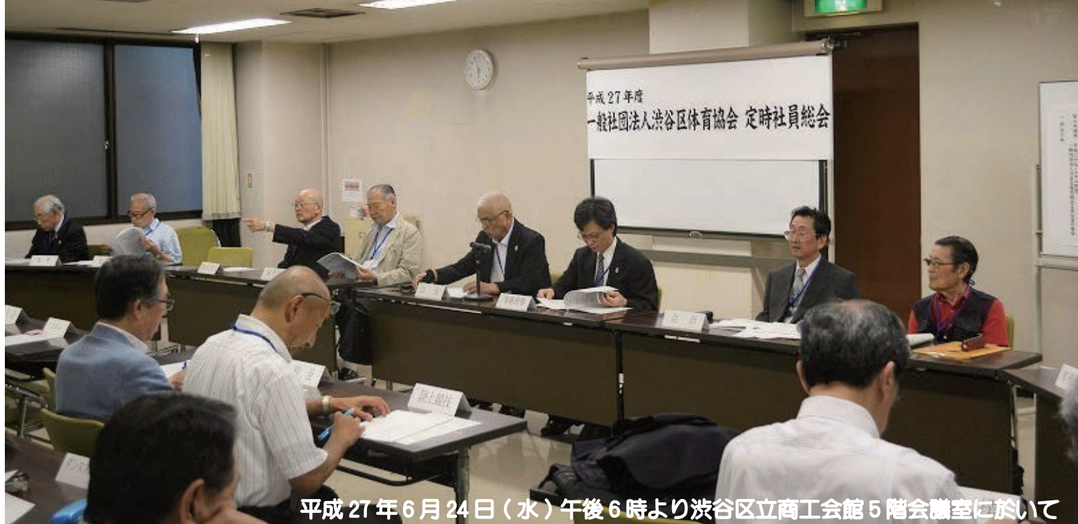
平成27年6月24日(水)午後6時より渋谷区立商工会館5階会議室に於いて