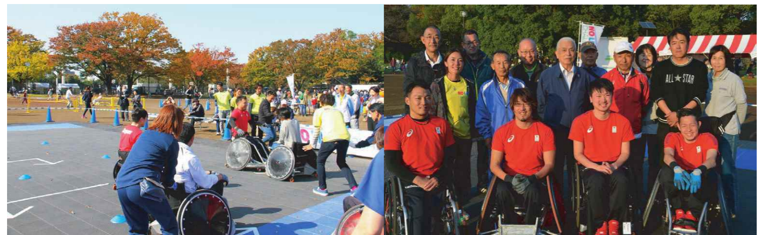
東京オリンピック・パラリンピック 気運醸成事業 ウィルチェアラグビー体験

両日にわたり、代々木公園サッカー場において親子で楽しめるファミリースポーツ広場を運営し、2日目は2020東京オリンピック・パラリンピックに向けた気運醸成事業のサポートを行いました。多くの区民が秋満開の青空の下、スポーツを大いに楽しんだ2日間でした。