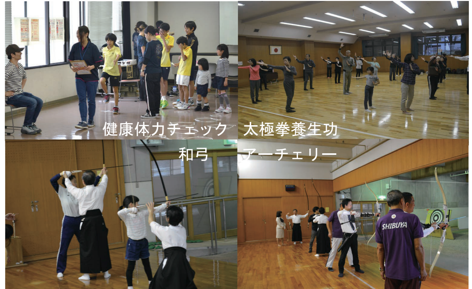
健康体力チェック