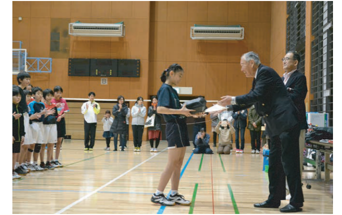
第19回ダイハツ全国小学生ABC大会 東京都予選会優勝 第27回全国小学生バドミントン選手権大会 東京都予選会優勝