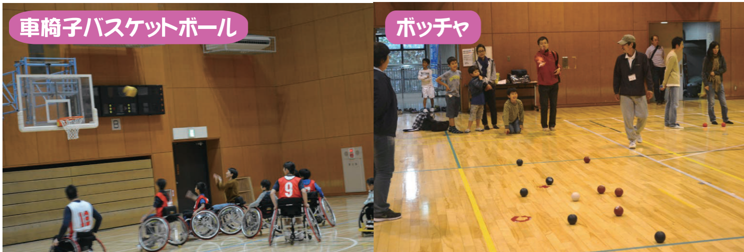
車椅子バスケットボール