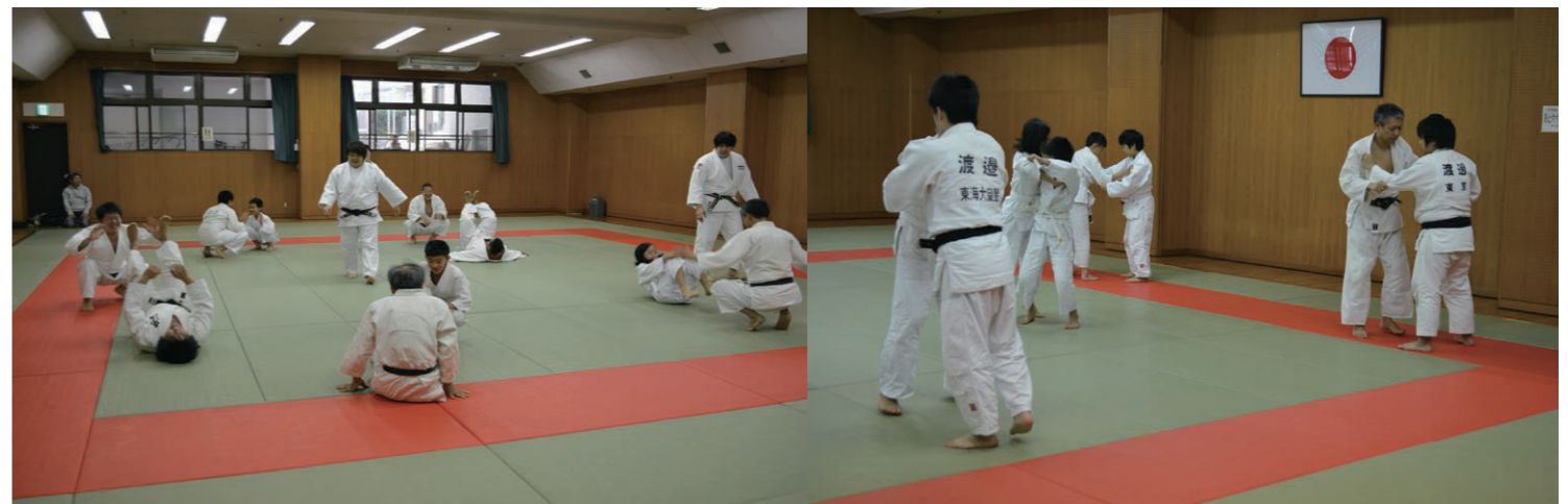
スペシャルゲスト